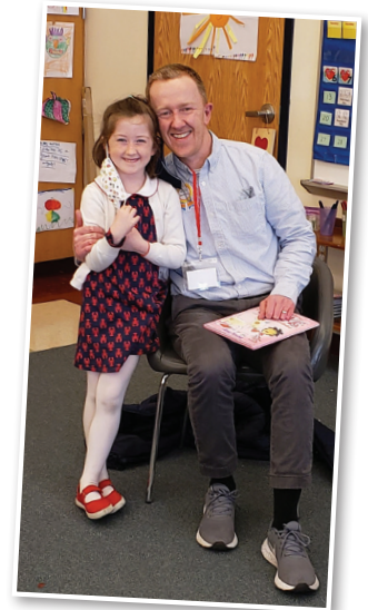
Alice irradiaba de orgullo cuando llegué a su clase